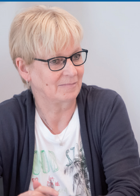
Maria Klein-Schmeink, MdB