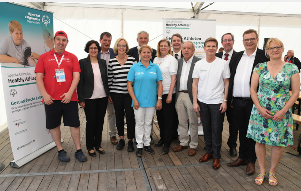
Foto: Eröffnung des Healthy Athletes Programms bei den Special Olympics in Kiel

soll auf diesem Wege ein psychotherapeutisches Betreuungsnetzwerk in Deutschland aufgebaut werden und damit der Zugang zur psychotherapeutischen Versorgung für alle Menschen mit geistiger Behinderung in Deutschland verbessert werden.